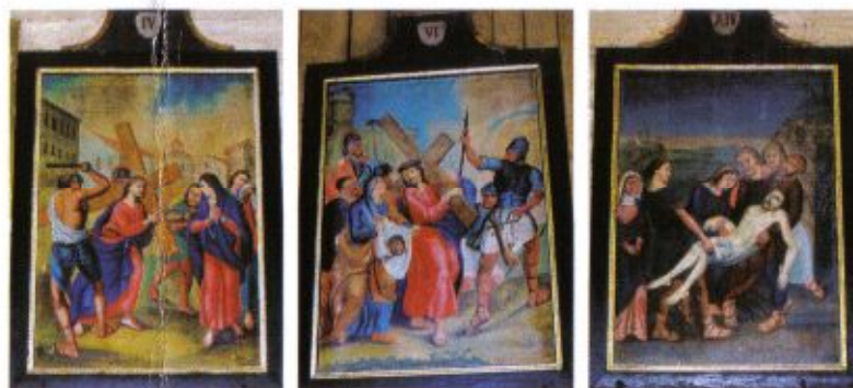
Stacje Drogi Krzyżowej z XIX wieku