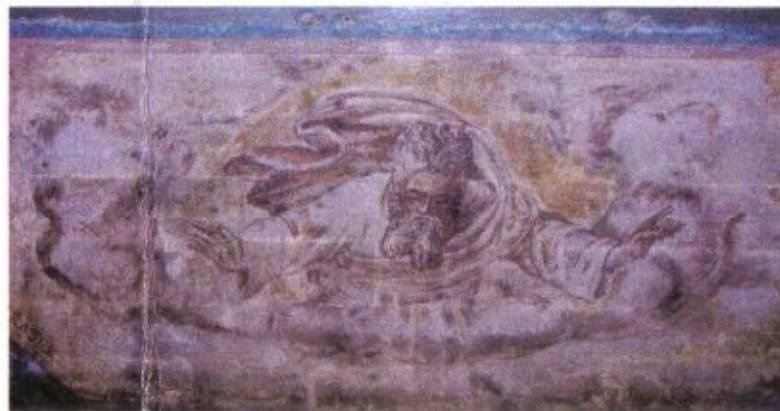
Bóg Ojciec – malowidło na stropie kościoła

W 1992 roku konsekrowany został nowy murowany kościół. „Stary” kościół pw. św. Piotra i Pawła stanowi jedną z „pereł” architektury sakralnej na szlaku drewnianych kościołów Śląska Opolskiego.