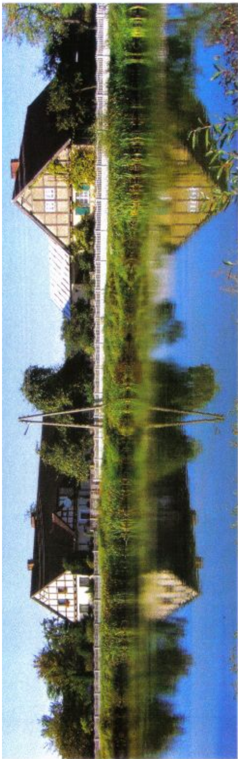
Szachulcowa konstrukcja budynków przy ulicy Kościelnej – lata 30-ste XX w.