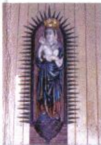
Gotycka rzeźba Matki Boskiej z Dzieciątkiem z XIV wieku