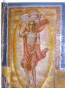
Chrystus Zmartwychwstały – malowidło na stropie kościoła.

Zakrzów Turawski to malowniczo położona wśród pól i lasów wieś w gminie Turawa. Po raz pierwszy wzmiankowana w 1593 roku.